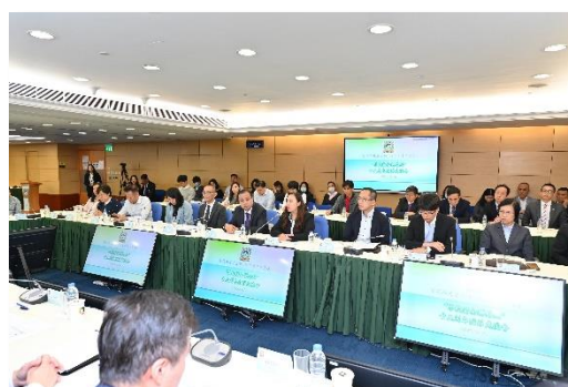
非高等教育及回歸教育專場