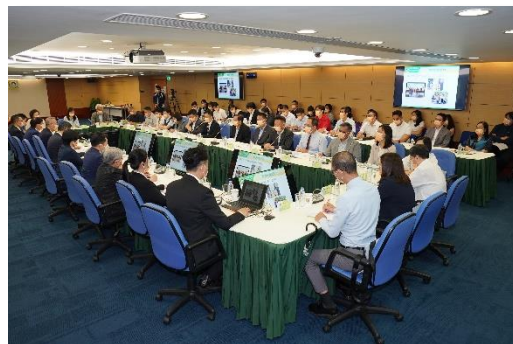
非高等教育及回歸教育專場