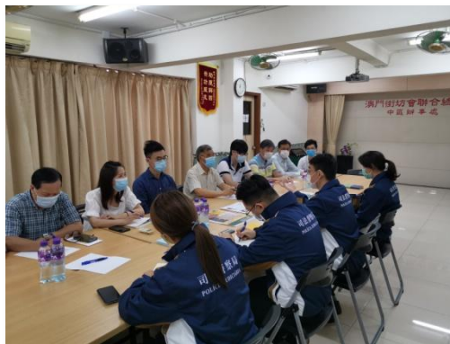
▲ 會晤交流 ▲