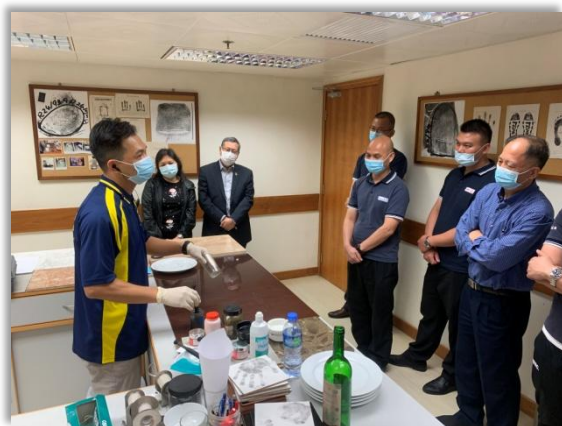
▲ 保安員培訓 ▲