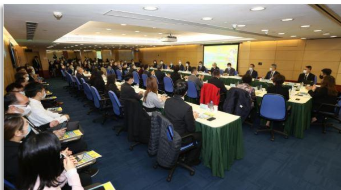
▲ 治安交流會議 ▲