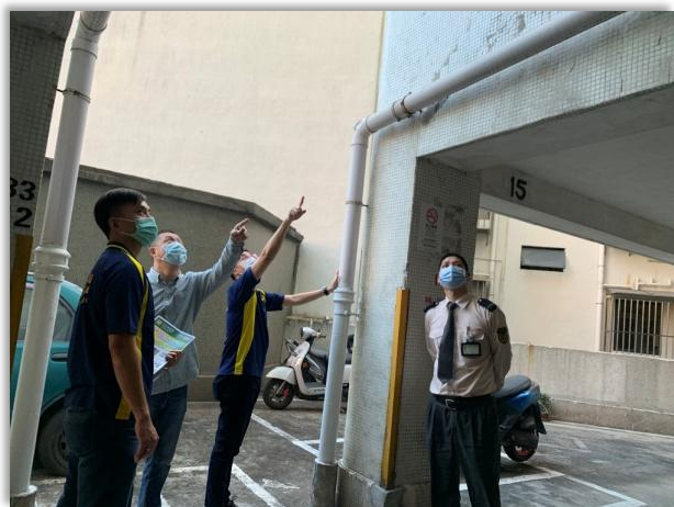
▲ 與保安員聯合巡查 ▲

此外，小組還借助“大廈防罪之友”會員於社區的影響力，於長假期前夕聯同會員前往案件多發地點進行特別巡查和宣傳工作，向居民講解應注意的防罪事項，減低居民受到犯罪侵害的機會。