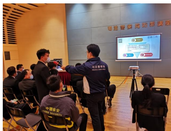
▲ 防罪講座 ▲