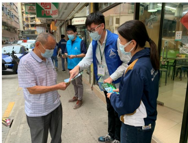
▲ 與社團聯合巡查 ▲