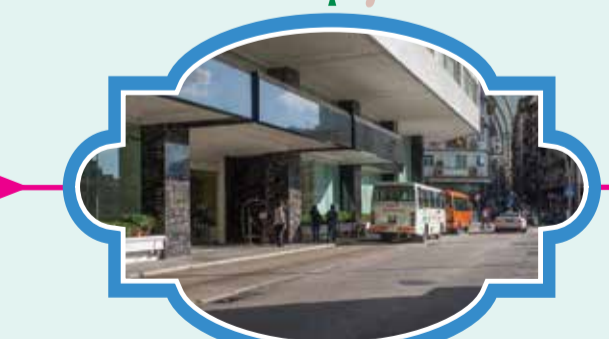
塔石廣場-皇都酒店 時間：12:00/13:00/14:30/15:30/16:30/17:30/18:30