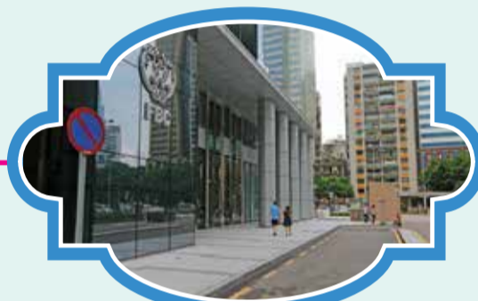
財神商業中心 (新八佰伴側門對面) 時間：10:55/11:55/13:25/14:25/15:25/16:25/17:25