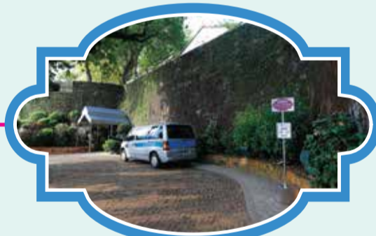
澳門聖地牙哥古堡 (酒店大門候車處) 時間：11:05/12:05/13:35/14:35/15:35/16:35/17:35