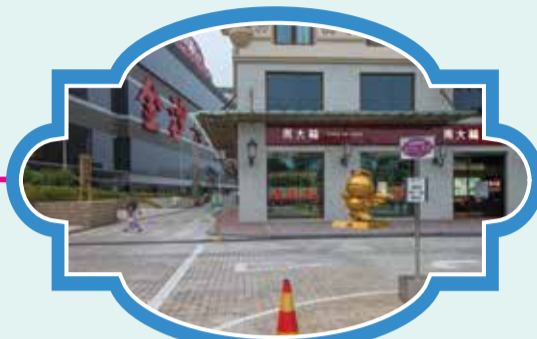
澳門漁人碼頭-勵庭海景酒店 時間：10:40/11:40/13:10/14:10/15:10/16:10/17:10