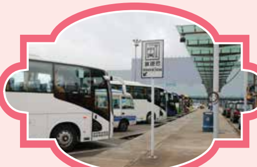
澳門國際機場 (旅遊巴士候車處) 時間：11:00/13:30/15:30/17:30