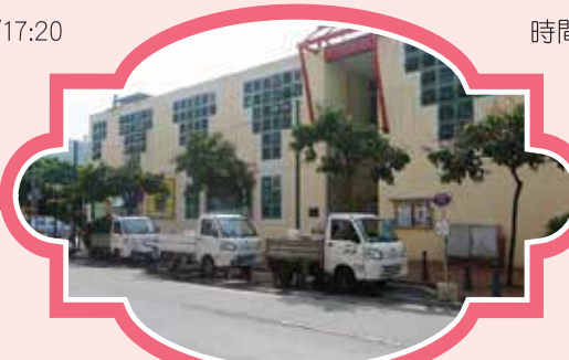
氹仔官也街 (氹仔街市前) 時間：11:10/13:40/15:40/17:40