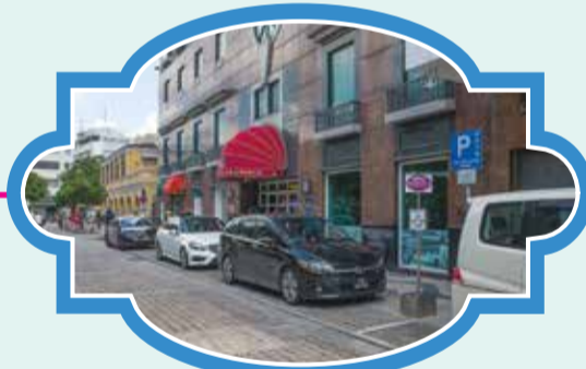
柯邦迪前地-新新酒店 (司打口) 時間：11:20/12:20/13:50/14:50/15:50/16:50/17:50