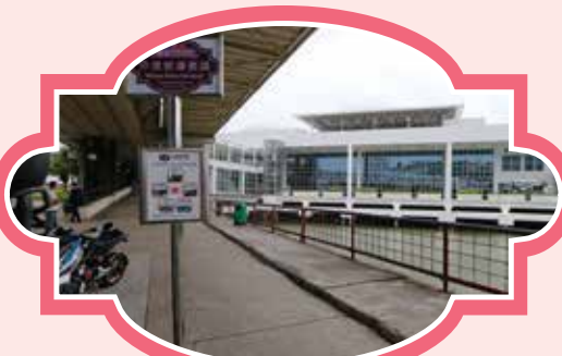
外港客運碼頭 (行人天橋下方之旅遊巴士候車處) 時間：10:30/13:00/15:00/17:00