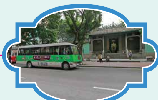
普濟禪院(觀音堂) 時間：11:50/12:50/14:20/15:20/16:20/17:20/18:20