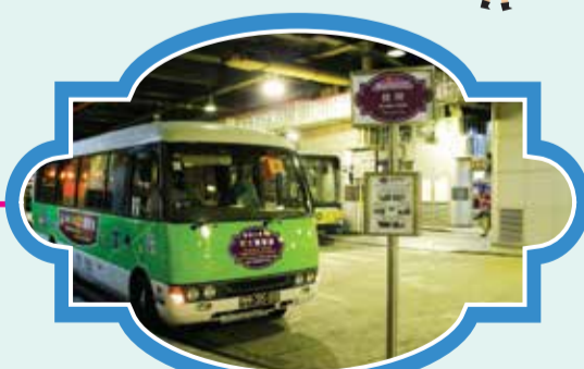
關 關 (關關廣場負一層旅遊巴士上車處) 時間：11:40/12:40/14:10/15:10/16:10/17:10/18:10