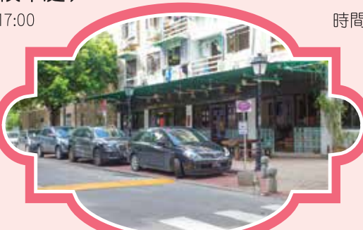
路環恩尼斯總統前地 (路環郵政局旁) 時間：11:35/14:05/16:05/18:05