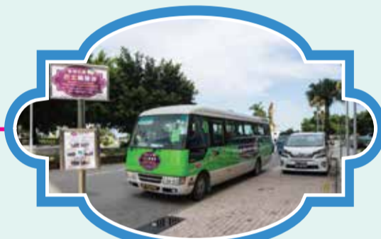
觀音蓮花苑 (帝景苑門前) 時間：10:45/11:45/13:15/14:15/15:15/16:15/17:15