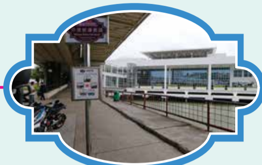
外港客運碼頭 (行人天橋下方之旅遊巴士候車處) 時間：10:30/11:30/13:00/14:00/15:00/16:00/17:00