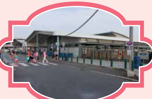
氹仔臨時客運碼頭 (離境大堂外) 時間：10:50/13:20/15:20/17:20