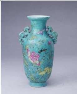
No. 102

Vaso de estilo Yongqing Changchun com duas asas e motivos “famille-rose” ( fencai ) de papoilas e grilos sobre fundo verde Reinado do Guangxu (1875 – 1908), Dinastia Qing Altura: 22 cm Diâmetro da boca: 7.3 cm Diâmetro do pé: 5.4 cm