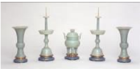
No. 005

Cinco utensílios sacrificiais de jade branco esverdeado