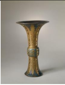
No. 83 © Museu do Palácio © Palace Museum

Vaso gu flangeado de estilo Qianlong de imitação de bronze antigo com motivos de flores e folhas de bananeira Reinado de Qianlong (1736 – 1795), Dinastia Qing Altura: 27.7 cm Diâmetro da boca: 17.5 cm Diâmetro do pé: 8.5cm