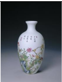
No. 097

Qianlong style faux archaic bronze gu vase with notched flanges and incised colourful flower and banana leaf motifs Reign of Qianlong (1736 – 1795), Qing Dynasty Height: 27.7 cm Mouth diameter: 17.5 cm Base-stand diameter: 8.5 cm