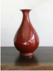
No. 002

Vaso de estilo Qianlong em forma de pêra vidrado a vermelho sacrificial