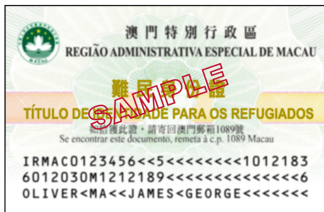
難民身份證的背面式樣

難民身份證內載有的資料包括：編號、首次發出日期、本次發出日期、有效期、持有人的姓名、出生日期、身高、出生地及性別代號、樣貌、簽名、光學閱讀代碼。